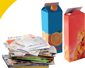
PAPIERS, EMBALLAGES ET BRIQUES EN CARTON