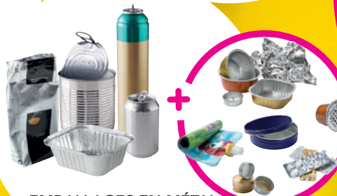
EMBALLAGES EN MÉTAL, MÊME LES PETITS